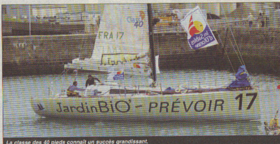
La classe des 40 pieds connaît un succès grandissant.

Pour contacter Lionel Régnier : 400millesabords@orange.fr